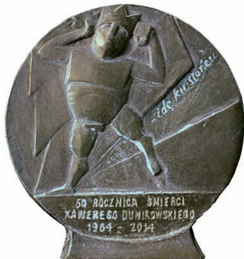
„Idę ku słońcu” – medal dwustronny – gips patynowany, śred. 10 cm, 2015 r.