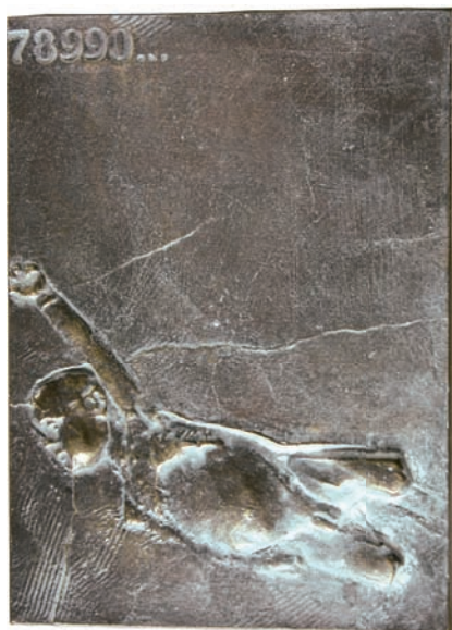
„I oto narodził się człowiek” – plakieta – brąz, 17x12 cm