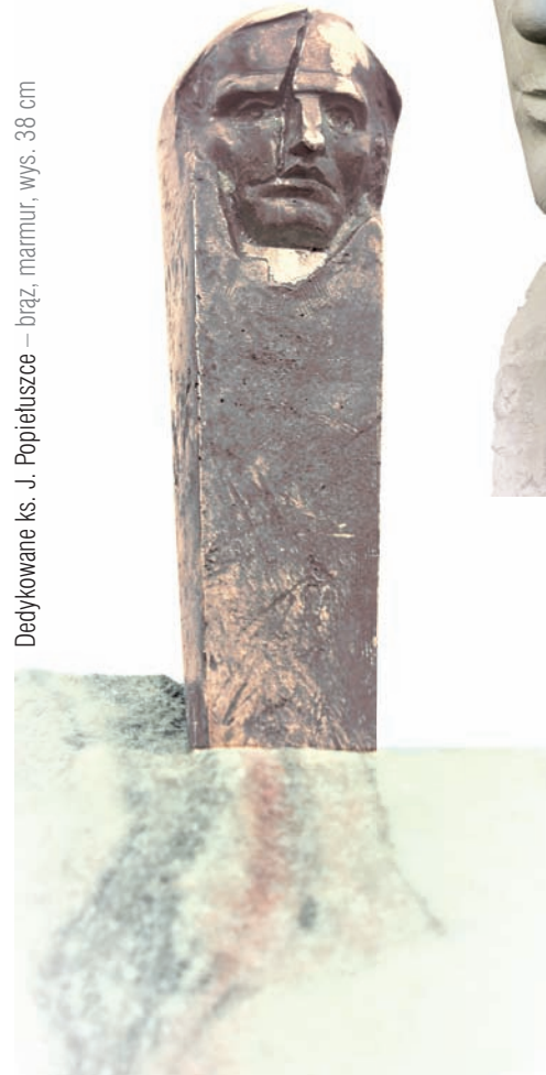
Dedykowane ks. J. Popietuszcze – brąz, marmur, wys. 38 cm