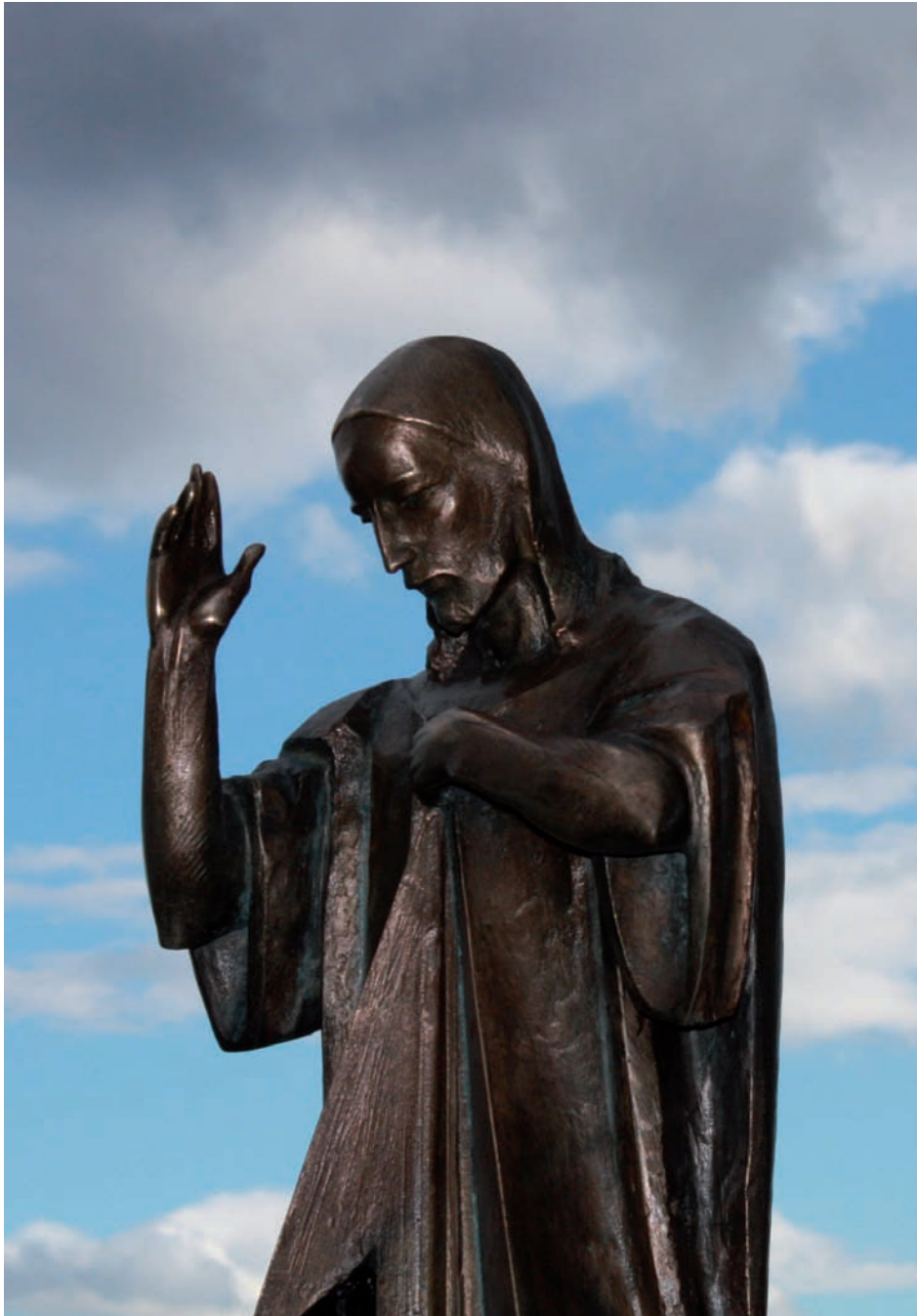
Rzeźba nagrobna, Cm. Salwator – brąz, granit, wys. 200 cm, 2018 r.