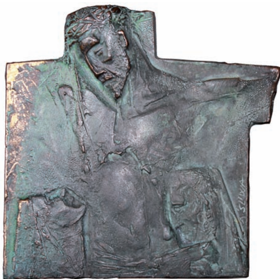
„Bez tytułu” – plakieta – brąz, wys. 15 cm