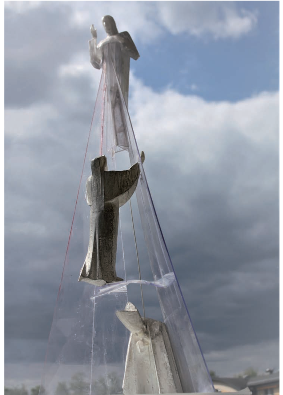
„Miej miłosierdzie dla nas... „ – gips patynowany, plexi, wys. 90 cm, 2020 r.