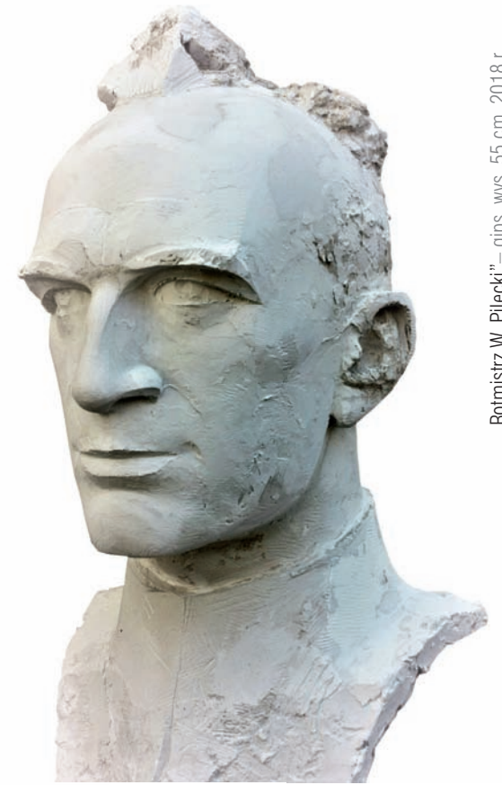
„Rotmistrz W. Pilecki” – gips, wys. 55 cm, 2018 r.