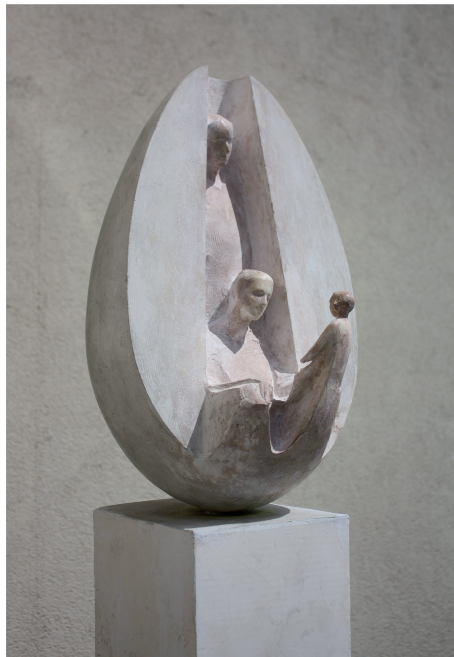
„Bez tytułu” – gips patynowany, wys. 70 cm