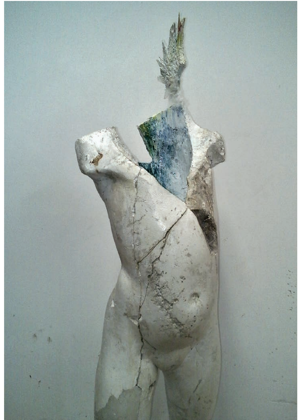
„Przepoczwazanie” – gips patynowany, wys. 70 cm, 2017 r.