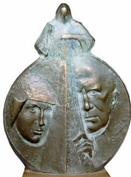
„Jezu Ufam Tobie” – brąz patynowany, wys. 20 cm, 2008 r.