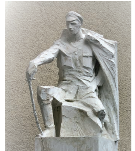
„Legiony to - rycerska buta” – gips, wys. 68 cm, 2017 r.