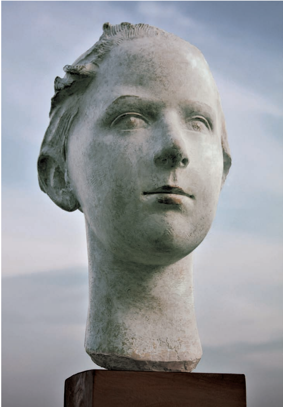
„Ela” – gips patynowany, wys. 45 cm, 2019 r.