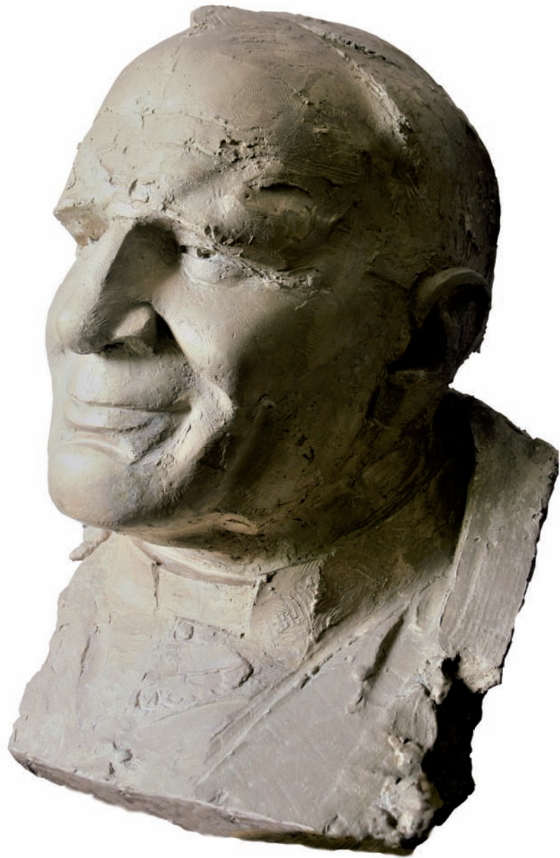
„Jan Paweł II” – gips patynowany, wys. 60 cm, 2005-2020 r.