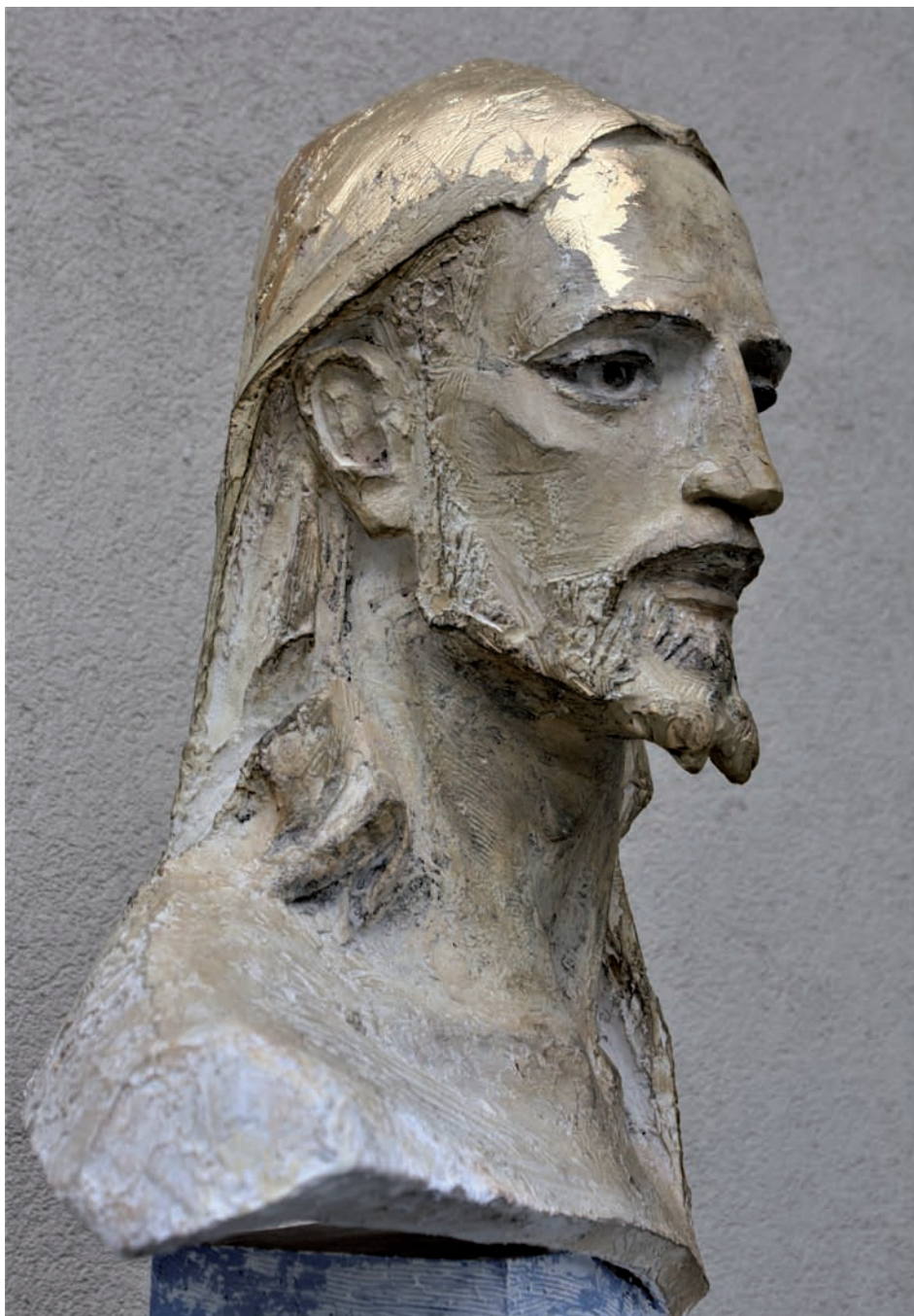
„Ja Jestem światłością świata” – gips patynowany, wys. 60 cm, 2020 r.